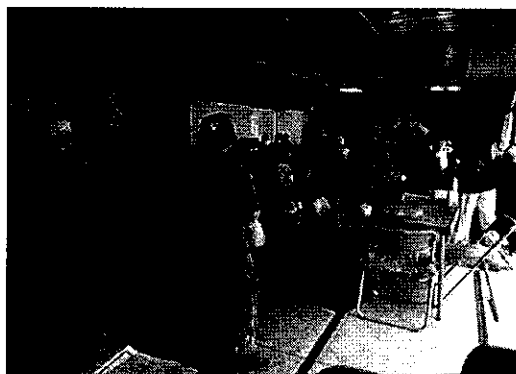
フレイル予防 キラキラ体操

コロナ禍で外出機会がほとんどありませんでしたので、フレイル予防体操として、大広間に設置してあるカラオケのコンテンツを活用し、おやつ前に入所者を集めた“キラキラ体操”を実施しました。よりコンテンツが充実したカラオケ機器にも変更しました。また、事故防止委員会でも転倒防止の教室を開き、入所者のフレイル予防に対する意識の向上を図りました。